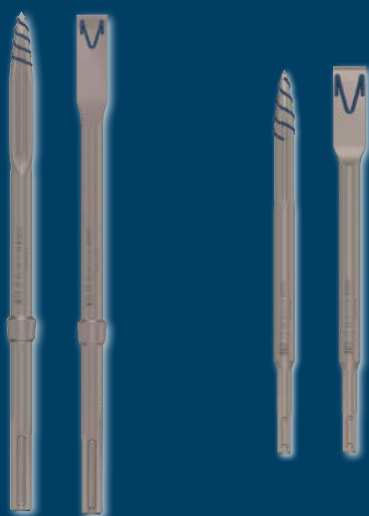
EXPERT SDS max-8C

Pour des performances durables et moins de blocage, les burins pointus et plats EXPERT SDS plus/SDS max-8C sont auto-affûtants. Grâce à leur conception spéciale, ils restent affûtés et tranchants, même lorsqu'ils s'usent, et ce tout au long de leur vie. Leurs nervures de puissance créent des fissures latérales et verticales dans le matériau, garantissant une progression rapide et réduisant les blocages.